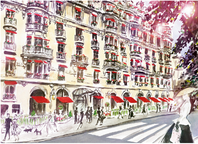
1 © Garance Wilkens/Agent&Artists