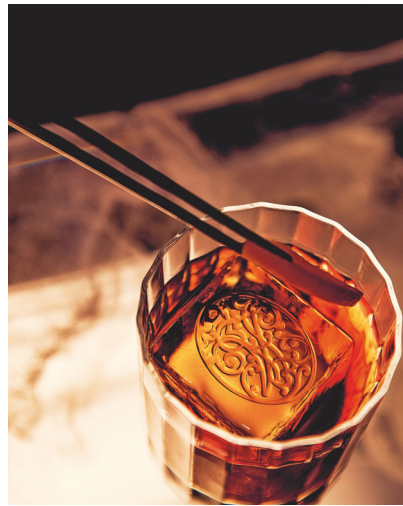
16 © Oliver Pilcher