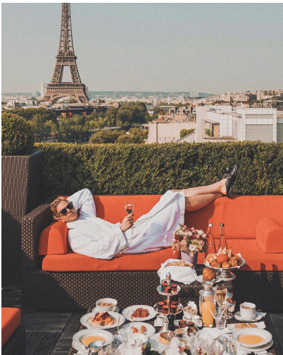
3 © Andrea Tamburrini