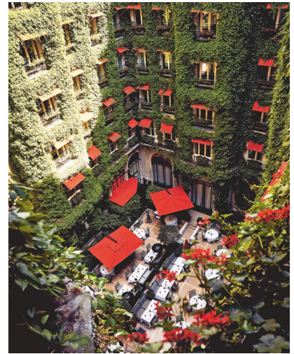
14 © Oliver Pilcher