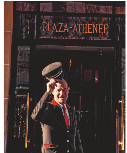
17 © Oliver Pilcher