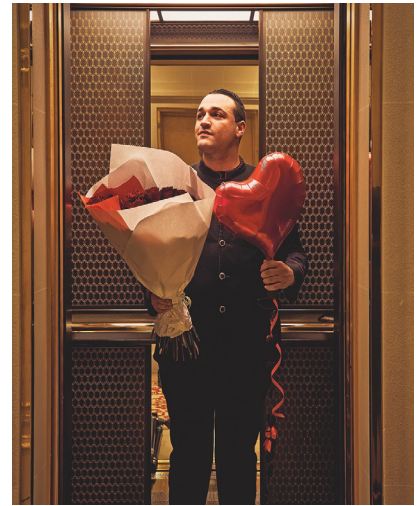
8 © Oliver Pilcher