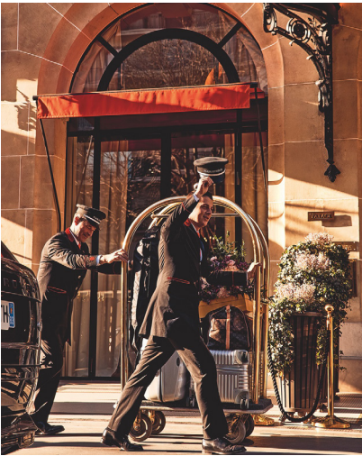
6 © Oliver Pilcher