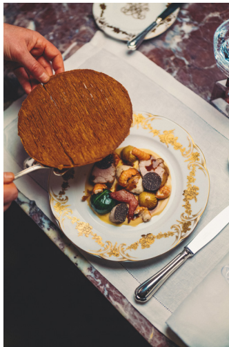
4 © Boby Odieux