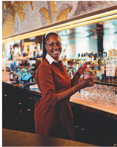
7 © Boby Odieux